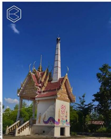
BUENKAN CONTEMPORARY ART นิทรรศการศิลปะร่วมสมัย ณ อาคารพิพิธภัณฑ์ อ.ไผ่พิสัย